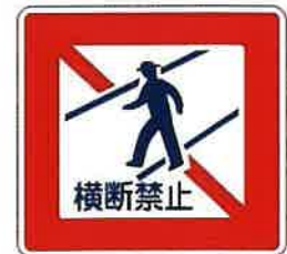
規制標識 (歩行者横断禁止)